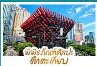
พิพิธภัณฑ์ศิลปะ ตึกตะเกียบ