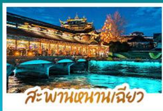
สะพานหนามเฉียว

เช็กอิน "ภูเขาสี่ครุณี" ชมทิวทัศน์ภูเขาหิมะติดกับผืนป่าสุดอลังการ ชมแสงสีสุดโรแมนติก BLUE TEARS ณ สะพานหนามเฉียว นั่งรถไฟความเร็วสูง เชื่อม 2 มหานคร เฉิงตู - ฉงชิ่ง ถ่ายภาพรถไฟกะตุ๊ก แลนด์มาร์กดังแห่งฉงชิ่ง เช็กอินจุดชมวิว LIGHT OF COPPER วิวยามค่ำคืนสุดตระการตา