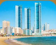
หาดแฮอินแด