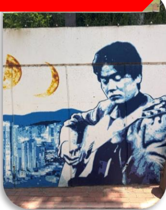
ถนนคิมควังชอก

นำท่านเที่ยวชม ถนนคิมควังชอก เป็นถนนสายเล็ก ๆ สุดอบอุ่นในเมืองแทกู ที่สร้างขึ้นเพื่อระลึกถึง คิมควังชอก นักร้องโฟล์กในตำนานของเกาหลีใต้ ผู้เกิดที่แทกูและเป็นศิลปินที่คนเกาหลียังคงรักมากจนถึงทุกวันนี้ เดิมทีบริเวณนี้เป็นกำแพงเก่าใต้ทางรถไฟ แต่ภายหลังถูกพัฒนาให้กลายเป็น "ถนนแห่งเสียงเพลงและความทรงจำ" ตลอดทางจะเต็มไปด้วยภาพวาดกราฟฟิตี้ รูปปั้นของคิมควังชอก งานศิลปะและมุมถ่ายรูปแนววินเทจ เส้นห์ของถนนนี้ไม่ใช่ความอลังการ แต่เป็นความรู้สึก "อบอุ่นและมีเรื่องราว" คาเฟ่ ร้านดนตรี และบรรยากาศย้อนยุค