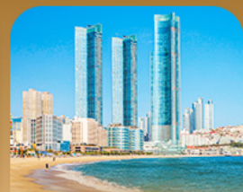
หาดแฮอินแด