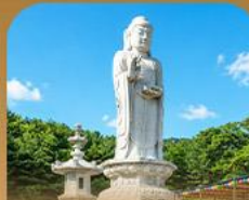
วัดคยองฮวาซา

เปิดประสบการณ์เที่ยวเกาหลีสุดคุ้ม 5 วัน 3 คืน เที่ยวสองเมือง • เช็กอินถนนนักร้องคิมควังซอก สัมผัสเสน่ห์ศิลปะและเสียงเพลง • นั่งรถไฟปิ๊งวิวทะเลปูซาน • หมู่บ้านคิมซอนสีลึกลับไส ก่อนเยือนวัดแฮดงยงกุงซาและวัดคยองฮวาซา เสริมความเป็นสิริมงคล • แวะชมท่าเรือสีรุ้ง Bunezia ปิดท้ายด้วยช้อปปิ้งเอาท์เล็ตแคว้นคังซ็อดึง พร้อมเดินช้อปปิ้ง Walking Street สุดฟิน