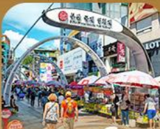
ตลาดนัมโพดง