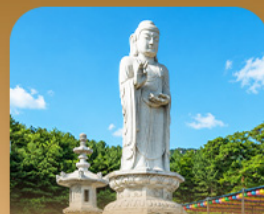
วัดดงฮวาซา

เปิดประสบการณ์เที่ยวเกาหลีสุดคุ้ม บินครั้งเดียว เที่ยวสองเมือง • เช็किनกอนนักร็องคัมคังซอก สัมผัสเสน่ห์ศิลปะและเสียงเพลง • นั่งรถไฟปู๊กบิกซมว็ททะเลปูซาน • หมู่บ้านคิมซอนสีสันสดใส ก่อนเยือนวัดแฮดงยงกุงซาและวัดดงฮวาซา เสริมความเป็นสิริมงคล • แวะชมท่าเรือสีรุ้ง Bunezia ปิดท้ายด้วยชายหาดแฮอินแดแลนด์มาร์กชื่อดัง พร้อมเดินช้อปปิ้ง Walking Street สุดฟิน