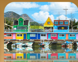
ท่าเรือจ้งเน็ม