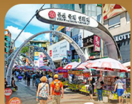
ตลาดนัมโพดง