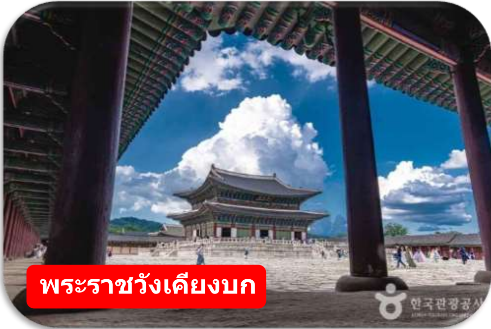
พระราชวังเคียงบก

พระราชวังเคียงบก (Gyeongbokgung) ไม่รวมค่าเช่าชุดฮันบก พระราชวังหลวงที่ยิ่งใหญ่ที่สุดของเกาหลี ท่านสามารถเดินถ่ายรูปภายในพระราชวัง ท่ามกลางสถาปัตยกรรมโบราณอันงดงาม ไม่ว่าจะเป็นห้องพระโรง ศาลาริมสระน้ำ และฉากภูเขาด้านหลังที่สวยงาม พร้อมทั้งเข้าชมพิพิธภัณฑ์พื้นบ้านเกาหลี