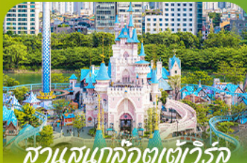
สวนสนุกล็อตเทเวิลด์ Lotte Adventure World