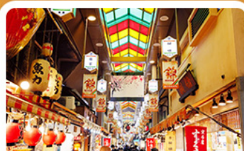
ตลาดปลาชิชิ