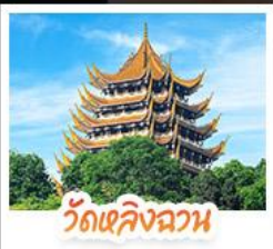
วัดเลิ่งฉวน