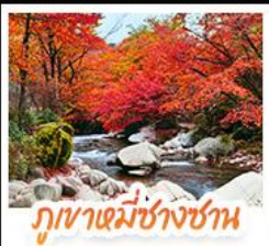
ภูเขาเหมี่ชางชาน