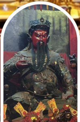
วัดกวนไท่ ขอเทพเจ้ากวนอู ความซื่อสัตย์ เงินทอง ธุรกิจมั่นคง