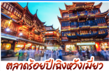
ตลาดร้อยปีเมืองเซี่ยงไฮ้