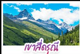
เขาสี่ดรุณี