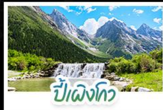
ปี๋เฉิงโกว