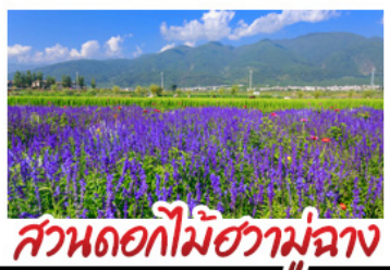
สวนดอกไม้ฮวงอวี่มู่ฉ่าง