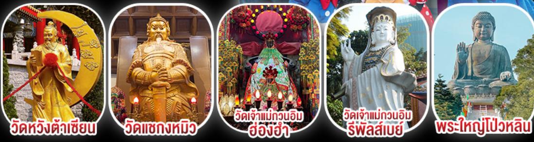
วัดหวังต้าเซียน | วัดเข่งหมิว | วัดเจ้าแม่กวนอิมฮ่องกง | วัดเจ้าแม่กวนอิมรีพัลส์เบย์ | พระใหญ่โป้วหลิน