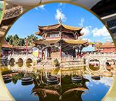
วัดหยวนทอง