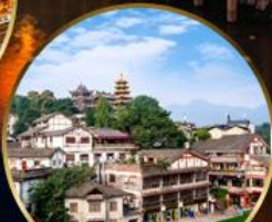
เมืองโบราณฉือจี้โข่ว