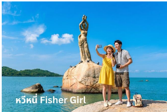
หวิหนี่ Fisher Girl

นำท่านสู่ จูไห่ ฟิชเชอร์เกิร์ล (Zhuhai Fisher Girl) หรือ สาวงามหวิหนี่ สาวงามกลางทะเล สัญลักษณ์ของเมืองจูไห่ บริเวณอ่าวเซียงหู สร้างขึ้นจากหินแกรนิตทราย เป็นรูปแกะสลักสูง 8.7 เมตร หวิหนี่ สาวงามที่ยืนถือไข่มุก ปิดเอาพลั่ว รื้อขายผ้า พัดพลั่ว รอยยิ้มทั้งบนใบหน้าถึงมุมปาก เป็นสัญลักษณ์ของเมือง บ่งบอกถึงความอุดมสมบูรณ์รุ่งเรืองแห่งเมืองจูไห่แน่นอนไม่ว่าใครไปเมืองจูไห่ก็ต้องแวะเวียนกันไปเยี่ยมเธอ