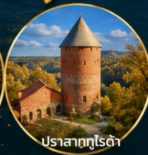
ปราสาทกูโรต้า