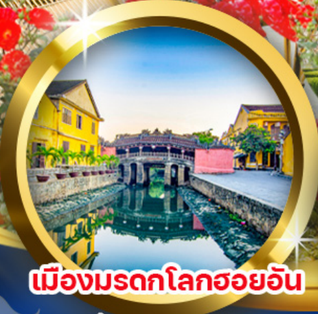
เมืองมรดกโลกฮอยอัน