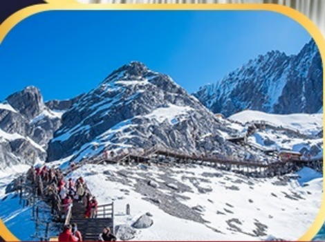
ภูเขาหิมะมังกรหยก