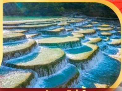
หุบเขาพระจันทร์สีน้ำเงิน