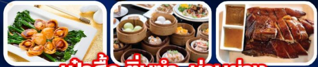
เป็ดปักกิ่ง, เต็มซ่า, ห่านย่าง