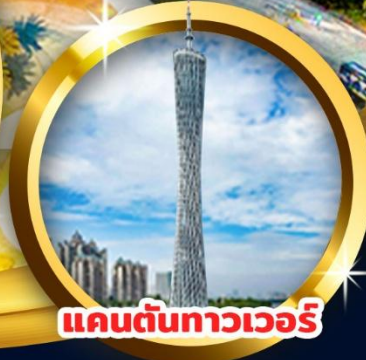
แคนตันทาวเวอร์