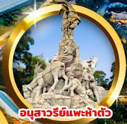
อนุสาวรีย์แพะห้าตัว