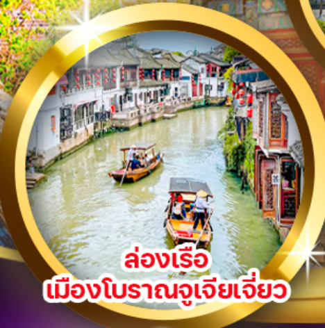
ล่องเรือ เมืองโบราณจูเจียเจี้ยว