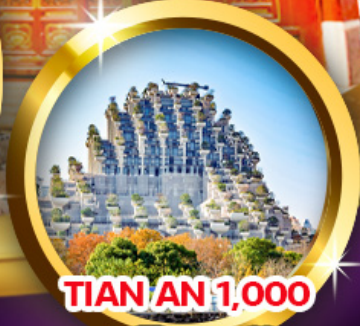
TIAN AN 1,000