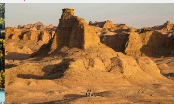
เมืองฝือเอ่อเหอ

*ทางบริษัทฯ ขอสงวนสิทธิ์ในการสลับโปรแกรมทัวร์ตามความเหมาะสมขึ้นอยู่กับสถานการณ์หน้างาน โดยคำนึงถึงผลประโยชน์ของลูกค้าเป็นสำคัญ