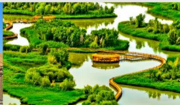
อุทยานพื้นที่ชุ่มน้ำจางเย่