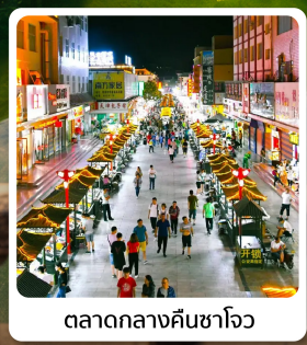
ตลาดกลางคืนซาโจว

ไฮไลท์! ภูเขาสายรุ้งจากเข้ตั้นเสี่ยภูเขาหลากสีสุดมหัศจรรย์ของจีน ถ้าไปเกาตุ ปรดกโลกแห่งเส้นทางสายไหมอายุเก่าแก่กว่า 1,000 ปี