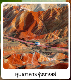
ภูเขาสายรุ้งจากเข้