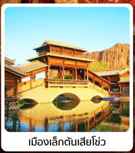
เมืองเล็กตั้นเสี่ยไซ่