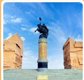
เขตท่องเที่ยวเจงกีสข่าน