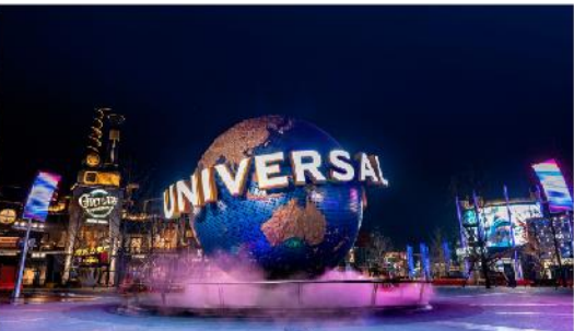
ยูนิเวอร์เซล ปักกิ่ง รีสอร์ท