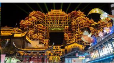
ตีทมห้ศจสรย 72