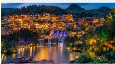
หมู่บ้านโบราณฟูหรงเจิน