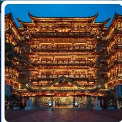
วัดต้าผ้อซื่อ