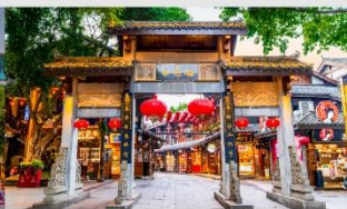
หมู่บ้านโบราณเฉียวชิว