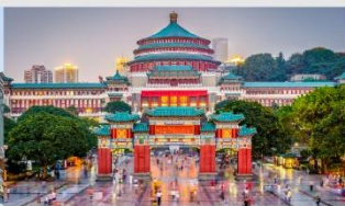
ศาลาประชาม