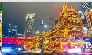
หงหยาดัง(ชมไฟยามค่ำคืน)

*ทางบริษัทฯ ขอสงวนสิทธิ์ในการสลับโปรแกรมทัวร์ตามความเหมาะสมขึ้นอยู่กับสถานการณ์หน้างาน โดยคำนึงถึงผลประโยชน์ของลูกค้าเป็นสำคัญ