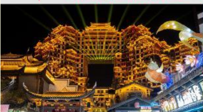
ตีทมส์ควอร์รี่ 72