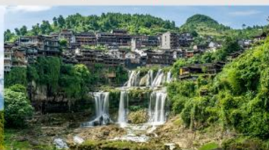
หมู่บ้านโบราณฝูหลงเจิน