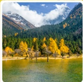
อุทยานแห่งชาติปี้เฟิงโกว