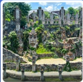
ปราสาทหินเย่หลางกู่