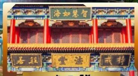
วัดจันทน์