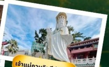
เจ้าแม่กวนอิมริฟัสเบย์