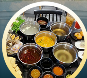
ซาปู้ฮ่องกง

02-04 มิ.ย. 18-20 มิ.ย. 07-09 มิ.ย. 20-22 มิ.ย. 13-15 มิ.ย. 25-27 มิ.ย. 14-16 มิ.ย. 28-30 มิ.ย.