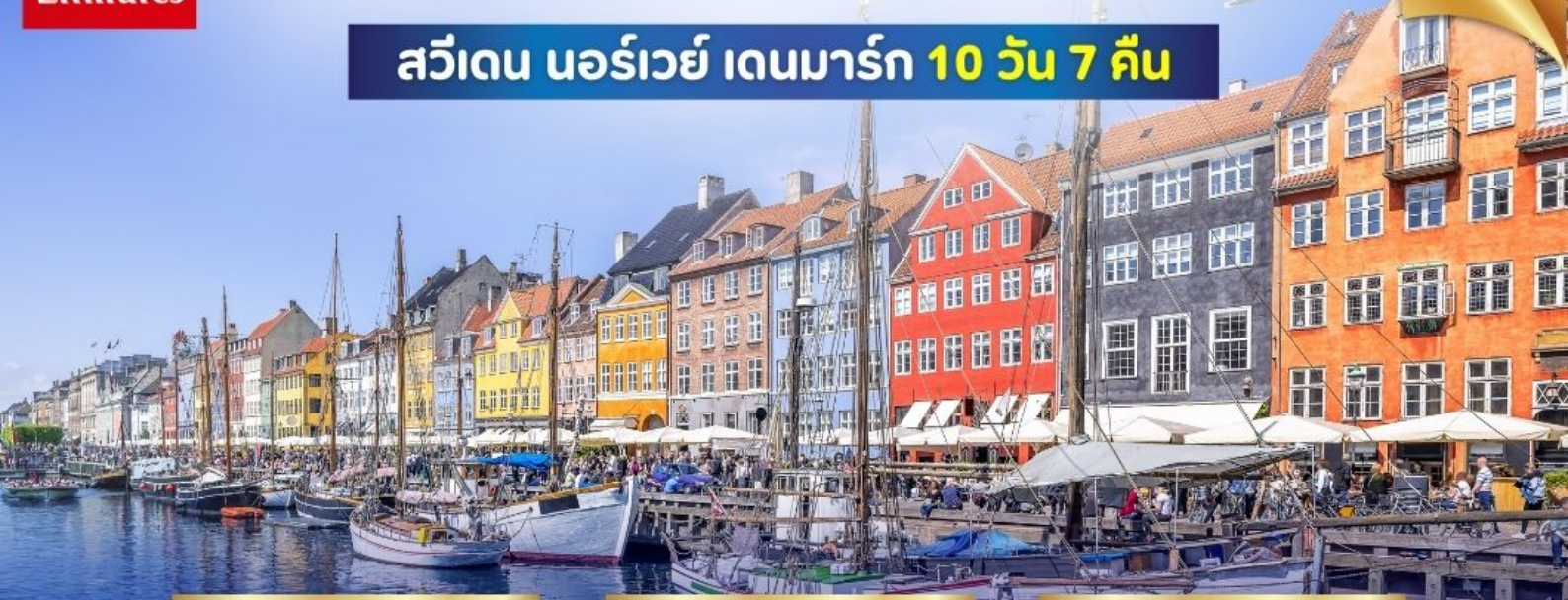
นอนบนเรือ 1 คืน