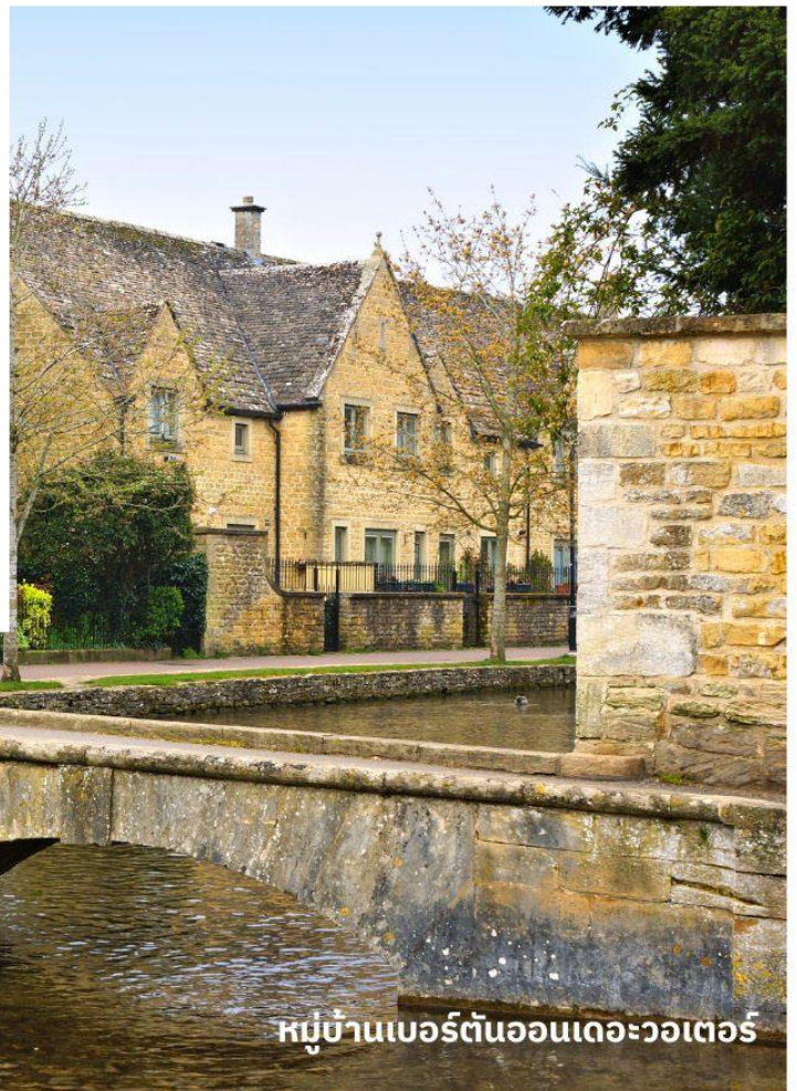
หมู่บ้านเบอร์ตันออนเดอะวอเตอร์

จากนั้นนำท่านเดินทางสู่ เขตคอตส์วอลส์ เขตหมู่บ้านชนบทแสนสวยของอังกฤษถึง 70 หมู่บ้าน ใช้เวลาเดินทางประมาณ 3.30 ชั่วโมง นำท่านเที่ยวชม หมู่บ้านเบอร์ตันออนเดอะวอเตอร์ (Bourton On The Water) หมู่บ้านเล็ก ๆ ที่รู้จักกันในนามของ “เวนิส แห่งคอตวอลส์” เมืองที่โด่งดังที่สุดในคอตส์วอลส์ ดูเจียบสงบบมีลำธารสายเล็ก ๆ (แม่น้ำวินด์ริช) ไหลผ่านกลางเมือง และมีสะพานหินทอดข้ามน้ำเป็นช่วง ๆ กับต้นวิลโลว์ที่แกว่งกิ่งก้านใบอยู่ริมน้ำ