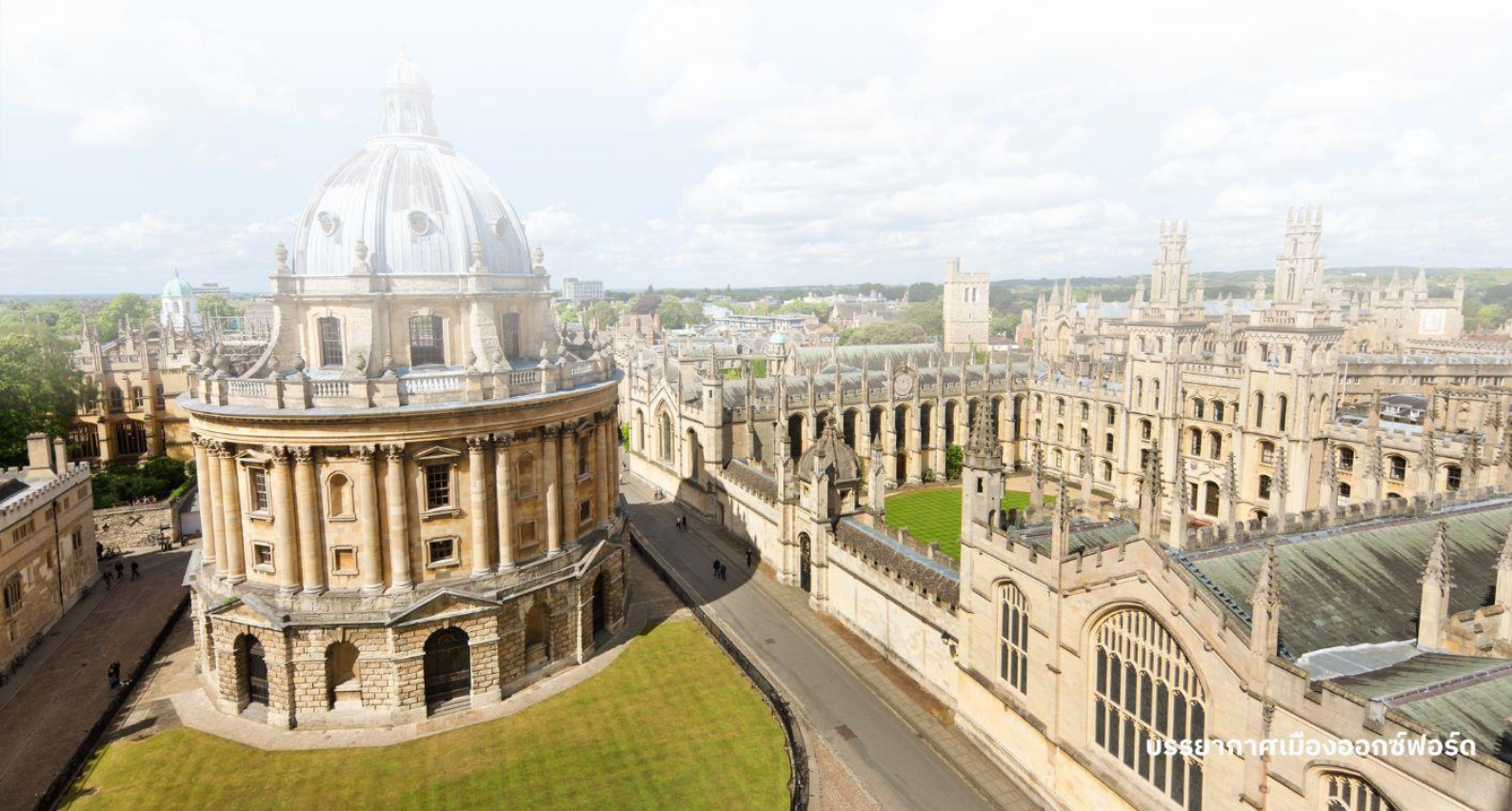
บรรยากาศเมืองออกซ์ฟอร์ด

จากนั้นนำท่านเดินทางไปยัง พระราชวังเบลนนิม ในมณฑลออกฟอร์ดเชียร์ ที่นี่เป็นที่เกิดของ เซอร์วินสตัน เชอร์ชิลล์ ผู้นำอังกฤษในสมัยสงครามโลกครั้งที่ 2 และเป็นพระราชวังสไตล์บารอกที่งดงามที่สุดในอังกฤษ Blenheim Palace นั้นเป็นวังเดียวในอังกฤษที่เจ้าของไม่ได้เป็นเชื้อพระวงศ์ แต่วังแห่งนี้เป็นที่พำนักอาศัยหลักของ Dukes of Marlborough และภายหลังได้รับการยกย่องเป็น World Heritage Site โดย UNESCO ในปี ค.ศ. 1987 อิสระให้ท่านถ่ายภาพพระราชวังจากด้านนอกตามอัธยาศัย