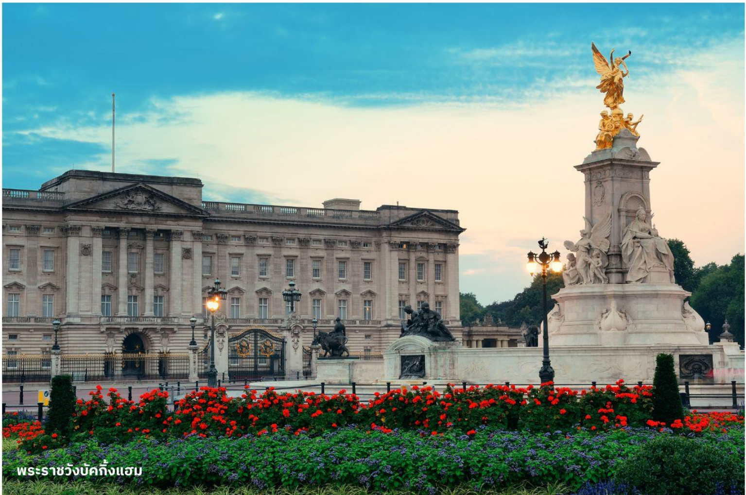
พระราชวังบักกิงแฮม

ได้เวลาอันสมควรนำท่านสู่สนามบิน เพื่อเตรียมตัวเดินทางกลับประเทศไทย