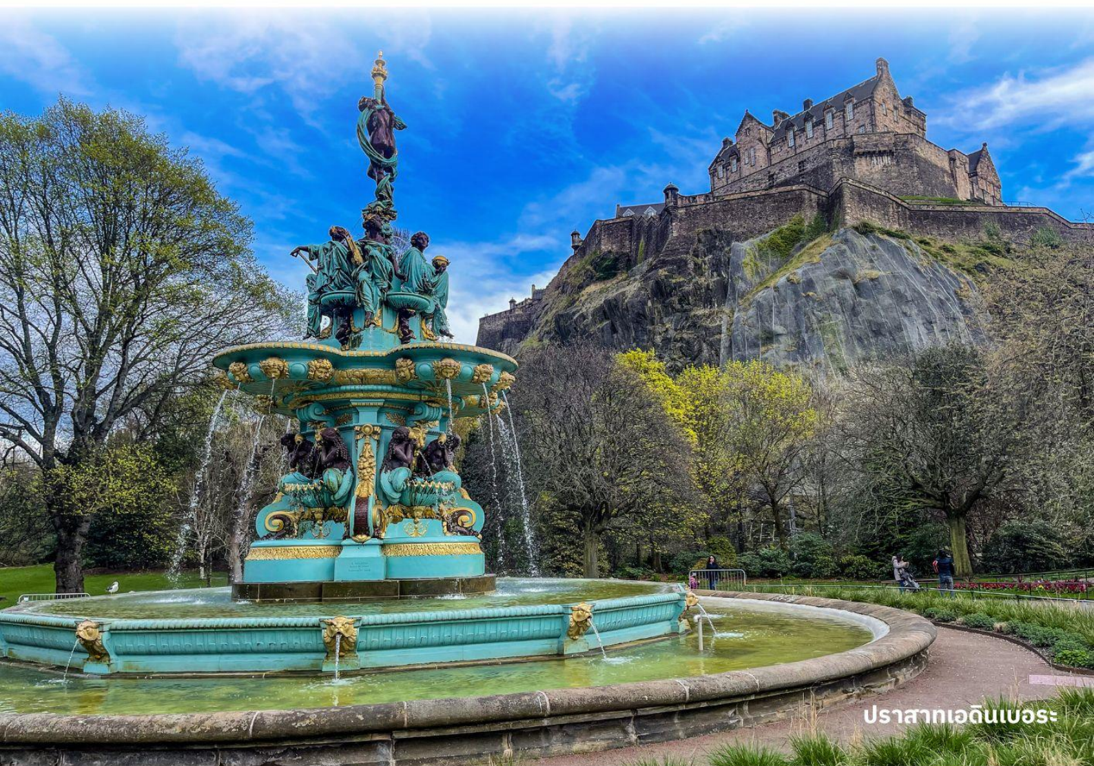
ปราสาทเอดินเบอระ

ผังตรงข้ามเป็นรัฐสภาแห่งชาติสกอตอันน่าทึ่งด้วยสถาปัตยกรรมร่วมสมัย