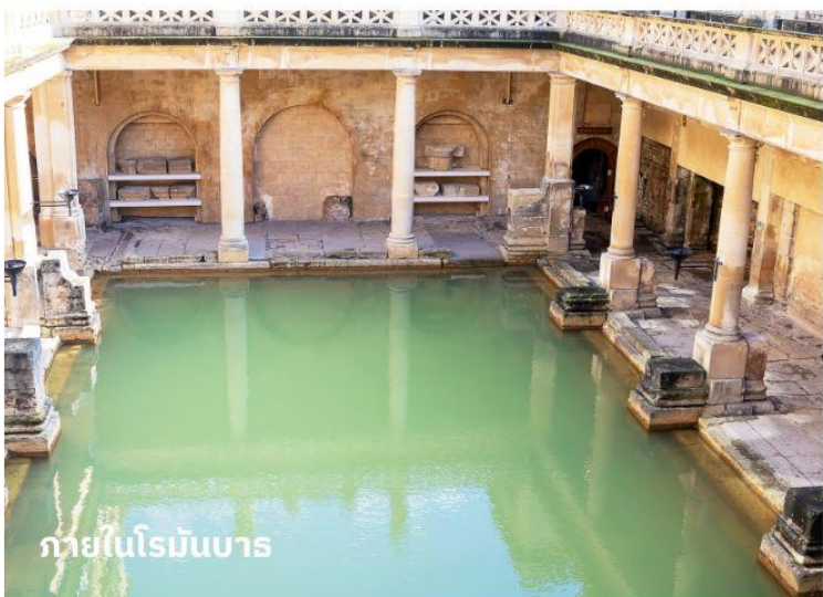
ภายในโรมันบาร