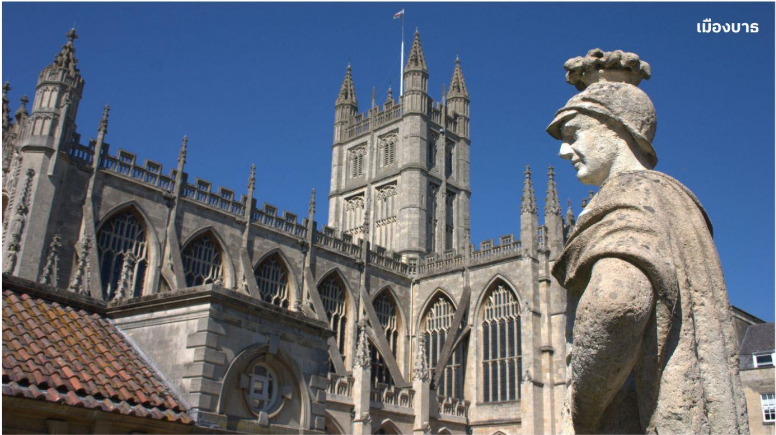
เมืองบาร

หลังจากนั้นนำท่านเดินทางสู่ เมืองบาร ดินแดนแห่งอาณาจักรโรมันอันยิ่งใหญ่บนเกาะอังกฤษเมื่อกว่า 2,000 ปีมาแล้ว ใช้เวลาเดินทางประมาณ 1.30 ชั่วโมง นำท่านเข้าชม โรงอาบน้ำแร่โรมัน ที่ชาวโรมันมาสร้างไว้เป็นสถานที่อาบน้ำแร่โดยอาศัยน้ำจากบ่อน้ำแร่ธรรมชาติที่จะมีน้ำไหลออกมาอย่างต่อเนื่องถึงวันละประมาณ 1,250,000 ลิตร และมีความร้อนถึง 46 องศาเซลเซียส ที่เมืองบารมี บ่อน้ำพุร้อนตามธรรมชาติ 3 แห่ง บ่อนที่ใหญ่ที่สุดคือที่ ROMAN SACRED SPRING น้ำพุจากใต้ดินลึก 3,000 เมตร มีแร่ธาตุถึงกว่า 43 ชนิด