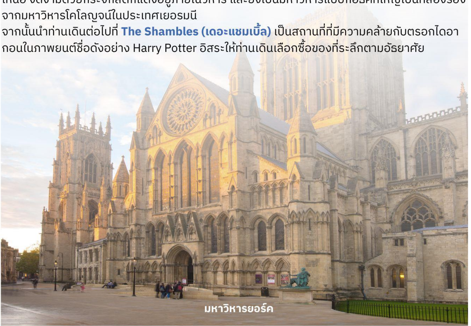
มหาวิหารยอร์ก

จากนั้นนำท่านเดินทางต่อไปที่ The Shambles (เดอะแซมเบิล) เป็นสถานที่ที่มีความคล้ายกับตรอกไดอากอนในภาพยนตร์ชื่อดังอย่าง Harry Potter อีสาระให้ท่านเดินเลือกซื้อของที่ระลึกตามอัธยาศัย