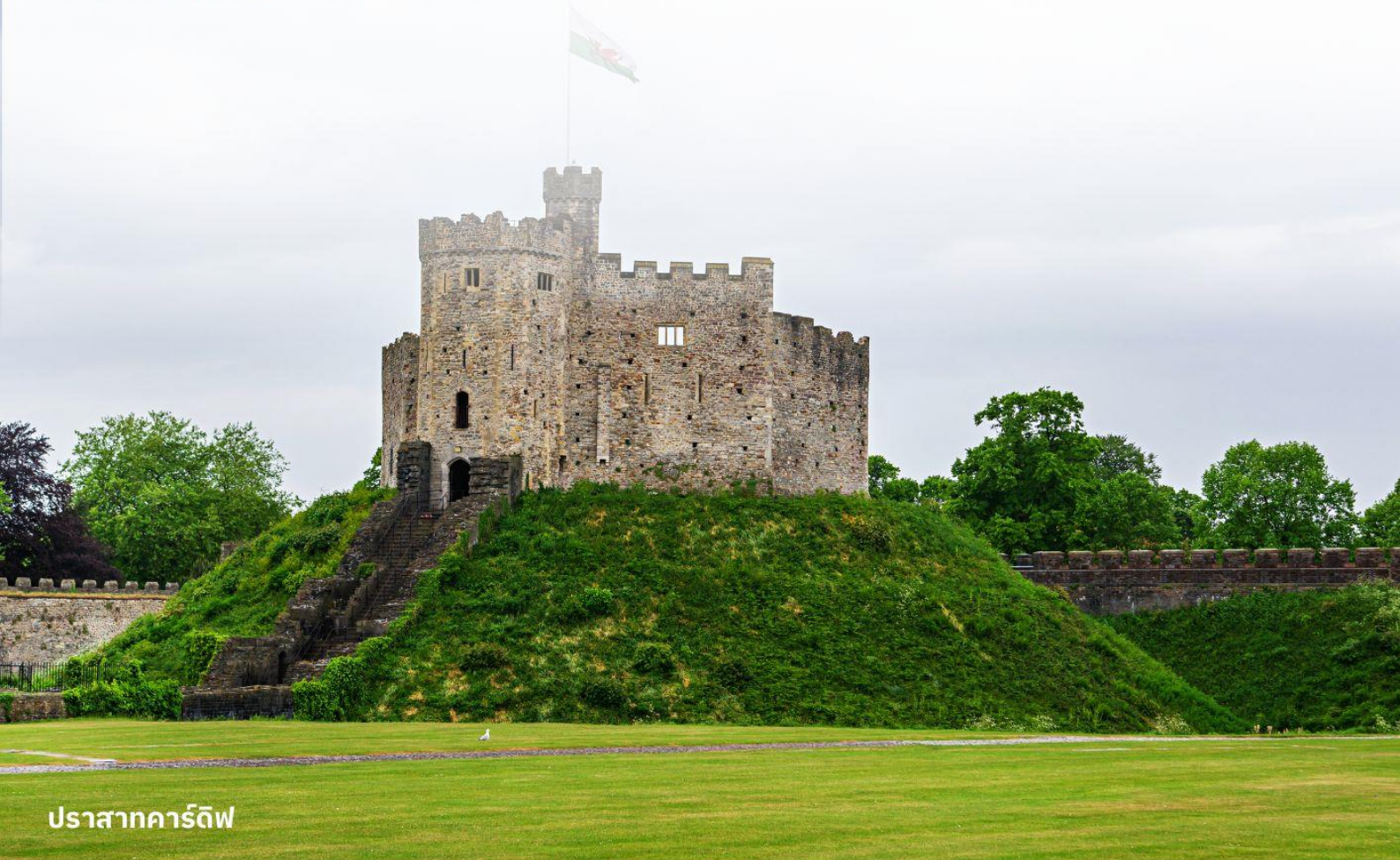
ปราสาทคาร์ดิฟฟ์

บริการอาหารค่ำ ณ ภัตตาคาร นำท่านเข้าสู่ที่พัก Clayton Hotel Cardiff หรือเทียบเท่า