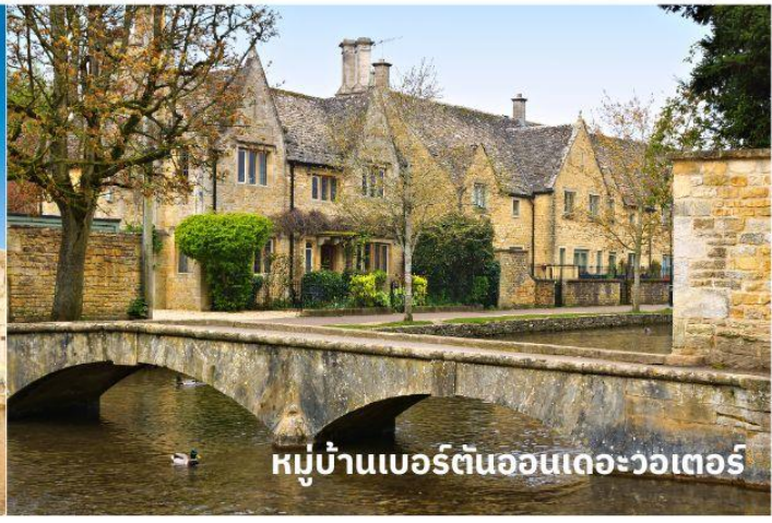
หมู่บ้านเบอร์ตันออนเดอะวอเตอร์