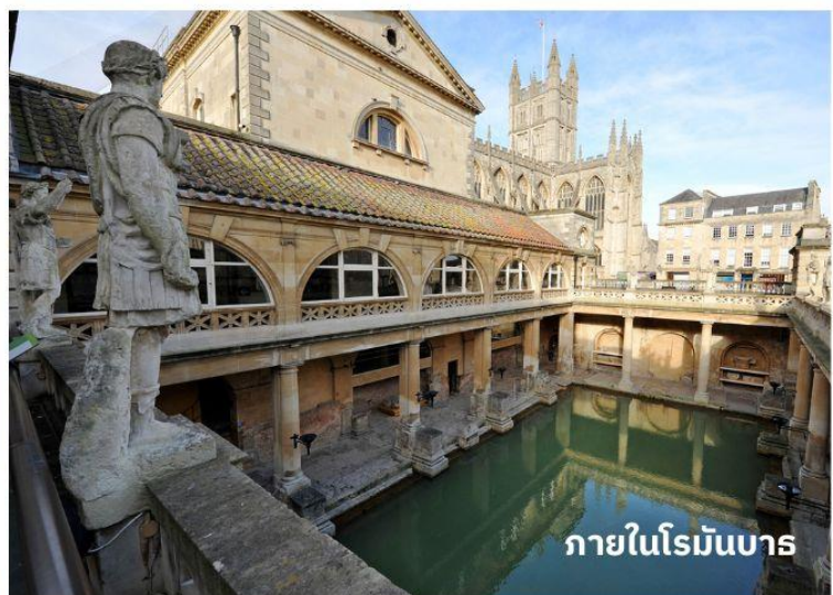
ภายในโรมันบาร