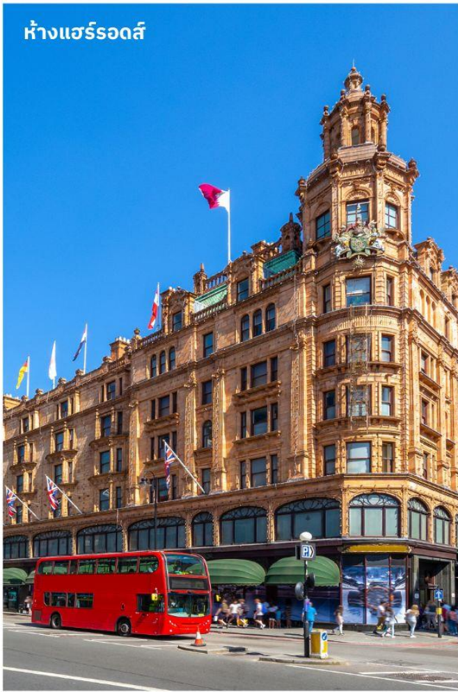
ห้างแฮร์รอดส์