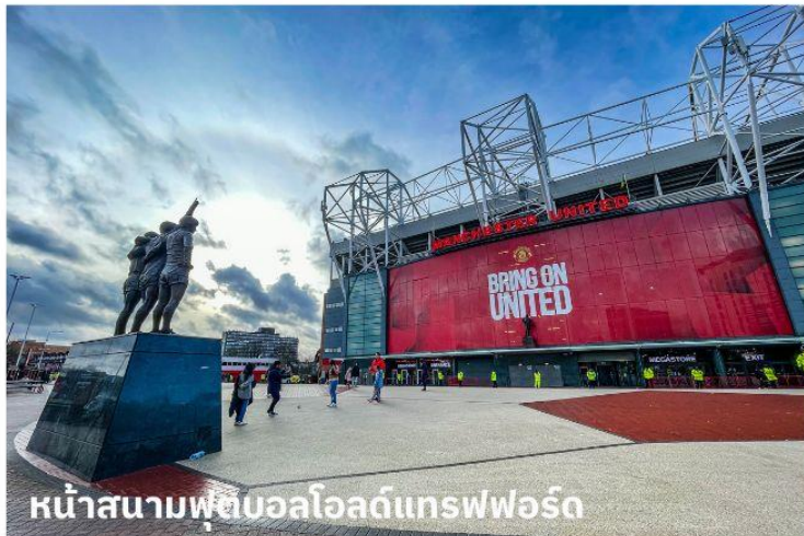
หน้าสนามฟุตบอลโอลด์แทรฟฟอร์ด