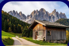
อุทยานฯ โดโลไมท์