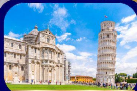
หอเอนแห่งเมืองปิซ่า

Special OFFER ฟรี !! ล่องเรือ Gondola เกาะเวนิส เมืองแห่งสายน้ำสุดโรแมนติก