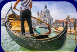
เที่ยวเกาะเวนิส