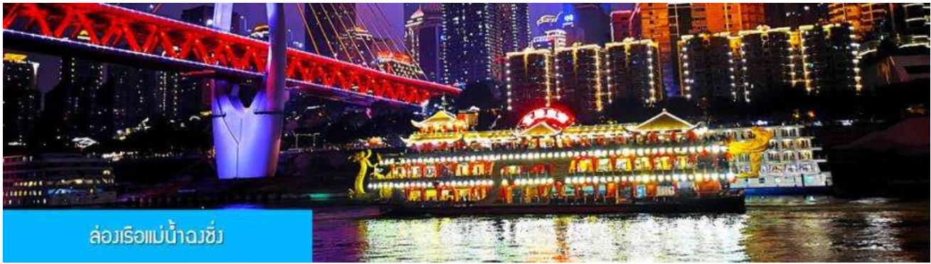
ล่องเรือแม่น้ำจางซิง