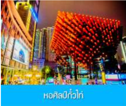
หอศิลป์แก้วไท่