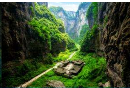
สะพานธรรมชาติสามแห่ง