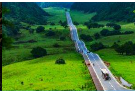
อุทยานเขาเนาวฟ้า