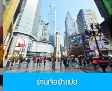
ย่านเจียฟางเปย

จากนั้นนำท่านเที่ยวชม หอศิลป์แก้วไท่ 国泰艺术中心 (อาคารตะเกียบ) จุดเช็คอินใหม่ของมหานครจงชิ่งที่เต็มไปด้วยศิลปะและสถาปัตยกรรมจีนร่วมสมัย ที่โดดเด่นด้วยรูปทรงที่เก๋ไก๋ทันสมัยและสุดตา.... จากนั้นนำท่านสู่ ย่านเจียฟางเปย 解放碑 แหล่งช้อปปิ้งใจกลางเมือง นครจงชิ่งที่เป็นแหล่งรวมห้างสรรพสินค้าและร้านตัวแทนจำหน่ายสินค้าแบรนด์เนมทั้งแบรนด์จีนและแบรนด์นำเข้าจากต่างประเทศ