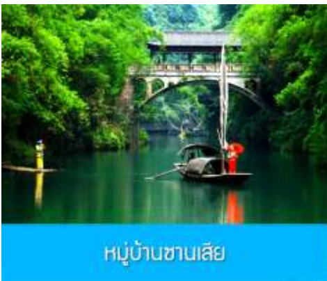
หมู่บ้านชาวนเลีย