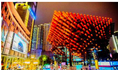
หอศิลป์กั๋วไท่

พักที่ HOLIDAY INN EXPRESS HOTEL โรงแรมระดับ 4 ดาวหรือเทียบเท่า เมืองฉงชิ่ง