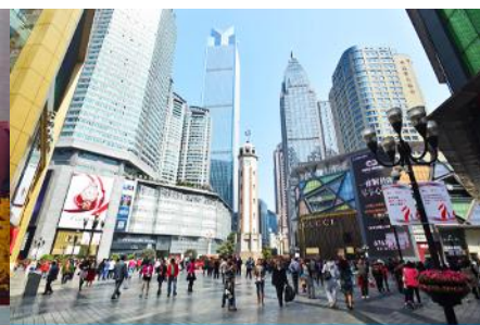
ย่านเจียวฟางเปย