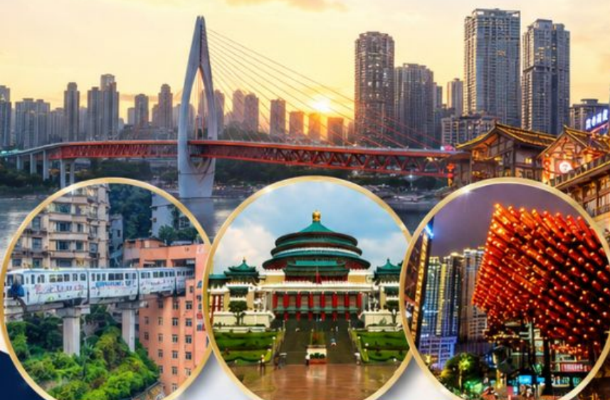
รถไฟทะลุติ๊ก Liziba Station