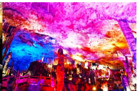
ถ้าเก้าสวรรค์จิวเทียนต้ง

วันที่สาม เมืองจางเจียเจีย-ศูนย์แพทย์แผนจีน -ศูนย์จำหน่ายผลิตภัณฑ์ยางพารา-ถ้าเก้าสวรรค์-อุทยานฟงเหลียนซี-ล่องเรือธารน้ำหมาเหียนหนอ-เมืองโบราณผู่หรงเจิน