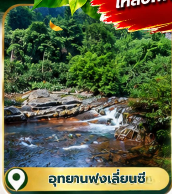
อุทยานฟงเลี่ยนซี