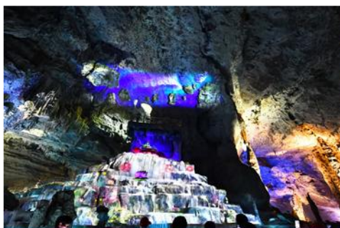
ถ้ำแก้วสวรรค์จิวเทียนถั่ว

พักที่ HANTING HOTEL ระดับ 4 ดาวท้องถิ่นหรือเทียบเท่าในเมืองจางเจียเจี๋ย