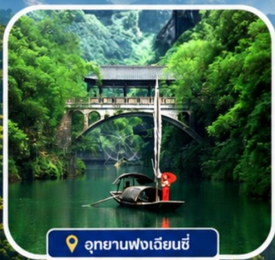
อุทยานฟงเจียนซี

อุทยานฟงเจียนซี | ถ้ำเก้าสวรรค์ | หมู่บ้านซานเสี่ย เมืองโบราณฝูหรงเจิ้น | ชิมอาหารเมนูพิเศษ บุฟเฟ่ต์หมู่บ้านเกาหลี่