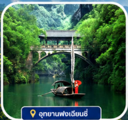
อุทยานพงเจียนซี

อุทยานพงเจียนซี | ถ้ำเก้าสวรรค์ | หมู่บ้านซานเสี เมืองโบราณฝูหลงเจิน | ซิมอาหารเมบูพิเศษ บุปเฟตหมูย่างเกาหลี