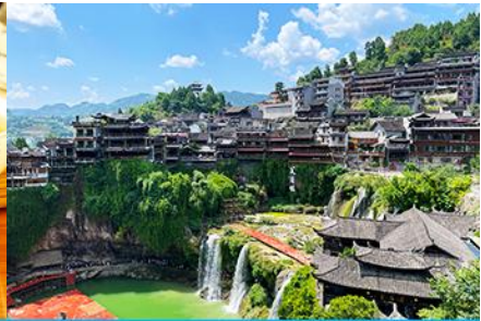
เมืองโบราณผู่หรงจิน

วันที่สาม เมืองจางเจียเจี๋ย-ศูนย์แพทย์แผนจีน-ศูนย์จำหน่ายผลิตภัณฑ์โบทา-ไกด์นำเสนอ OPTIONAL TOUR สะพานกระจกแกรนด์แคนยอน-เมืองโบราณผู่หรงจินยามค่ำคืน