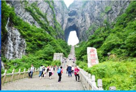
ประตูลูกเต๋ายื่น