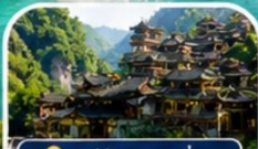
หมู่บ้านซานเสี่ย