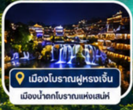
เมืองโบราณฝูหลงเจิน