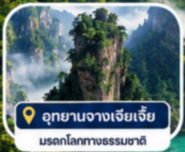
อุทยานงามเจียเจีย