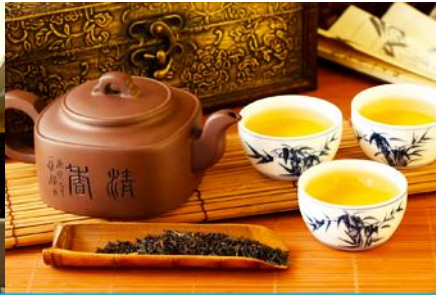
ศูนย์จำหน่ายผลิตภัณฑ์โบทา