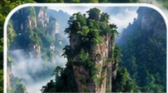
อุทยานจางเจียเจี๋ย