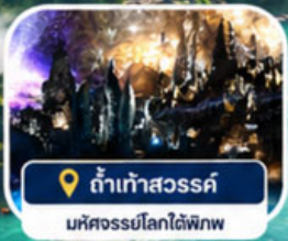
ถ้ำเก้าสวรรค์