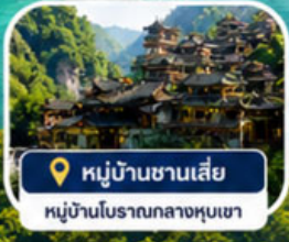
หมู่บ้านซานเสี