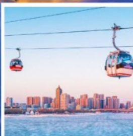
นั่งกระเช้าชมแม่น้ำซงฮวาเจียง