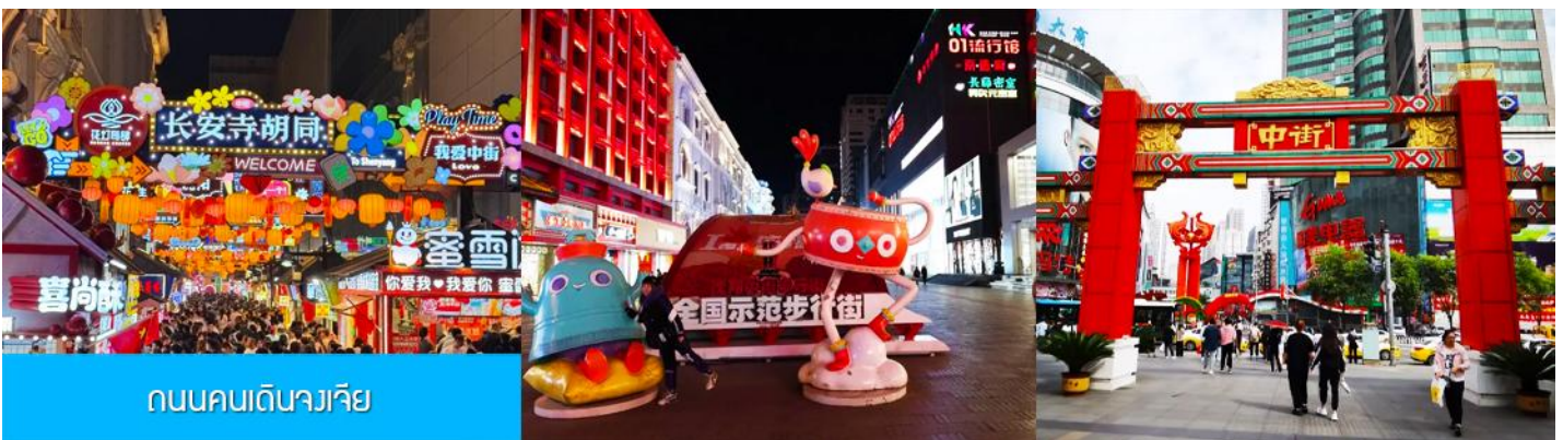
ถนนคนเดินจงเจีย

จากนั้นนำท่านเดินทางสู่ เมืองเสิ่นหยาง 沈阳市