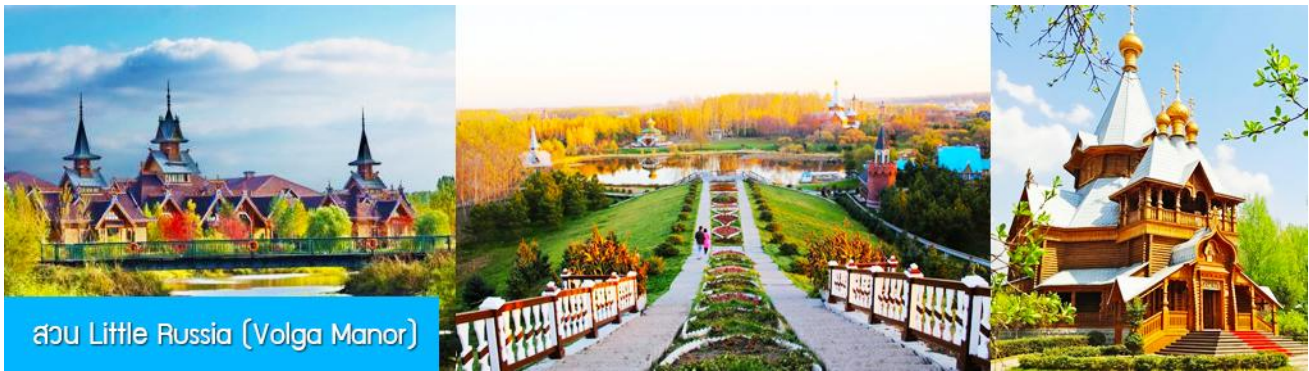
สวน Little Russia (Volga Manor)

หลังอาหารนำท่านเดินทางสู่ เมืองฮาร์บิน 哈尔滨市 (ระยะทาง 250 กม.ใช้เวลาเดินทางราว 3 ชั่วโมงเศษ) เมืองฮาร์บินเป็นเมืองที่ตั้งอยู่ทางตอนเหนือของจีนที่มีพรมแดนติดกับประเทศรัสเซีย เป็นเมืองเอกของมณฑลเฮยหลงเจียง มีสมญานามว่าเป็นกรุงมอสโกตะวันออก และได้ชื่อว่าเป็นเมืองหลวงแห่งฤดูหนาวเนื่องจากเมืองแห่งนี้มีช่วงฤดูหนาวยาวกว่าฤดูร้อน มีเทศกาลแกะสลักน้ำแข็งนานาชาติจัดขึ้นที่เมืองนี้ในช่วงฤดูหนาวของทุกปี เป็นจุดหมายปลายทางสำหรับนักท่องเที่ยวทั้งในและต่างประเทศที่ชื่นชอบความสวยงามของหิมะในฤดูหนาว