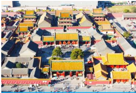
พระราชวังโบราณเสิ่นหยาง

รับประทานอาหารเช้า ณ ห้องอาหารของโรงแรม (4)