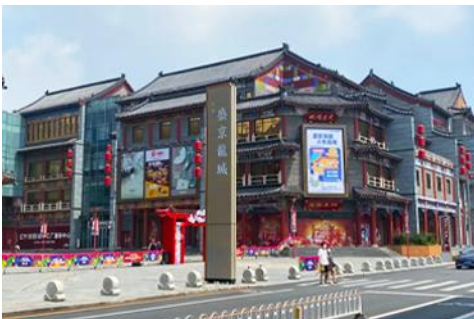
ถนนแมนจูเรีย