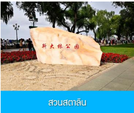
สวนสตาลิน