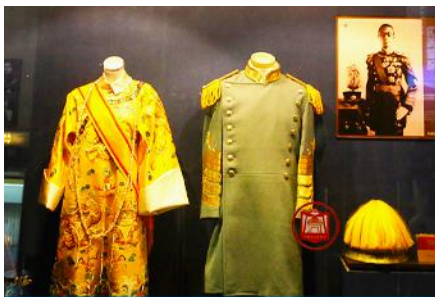
พระราชวังปูยี

รับประทานอาหารเช้า ณ ห้องอาหารของโรงแรม (7)