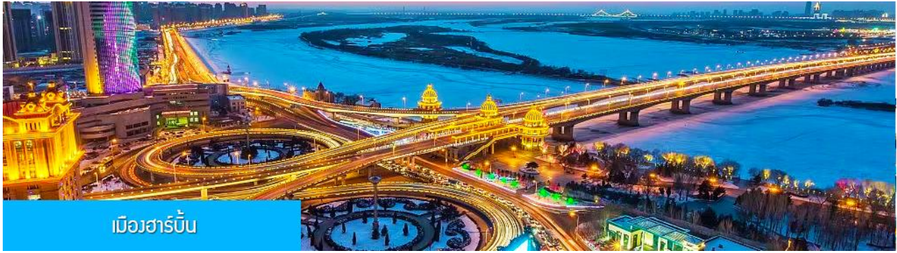
เมืองฮาร์บิน

หลังอาหารนำท่านเดินทางสู่ เมืองฮาร์บิน 哈尔滨市 (ระยะทาง 250 กม.ใช้เวลาเดินทางราว 3 ชั่วโมงเศษ) เมืองฮาร์บินเป็นเมืองที่ตั้งอยู่ทางตอนเหนือของจีนที่มีพรมแดนติดกับประเทศรัสเซีย เป็นเมืองเอกของมณฑลเฮยหลงเจียง มีสมญานามว่าเป็นกรุงมอสโกตะวันออก และได้ชื่อว่าเป็นเมืองหลวงแห่งฤดูหนาวเนื่องจากเมืองแห่งนี้มีช่วงฤดูหนาวยาวกว่าฤดูร้อน มีเทศกาลแกะสลักน้ำแข็งนานาชาติจัดขึ้นที่เมืองนี้ในช่วงฤดูหนาวของทุกปี เป็นจุดหมายปลายทางสำหรับนักท่องเที่ยวทั้งในและต่างประเทศที่ชื่นชอบความสวยงามของหิมะในฤดูหนาว