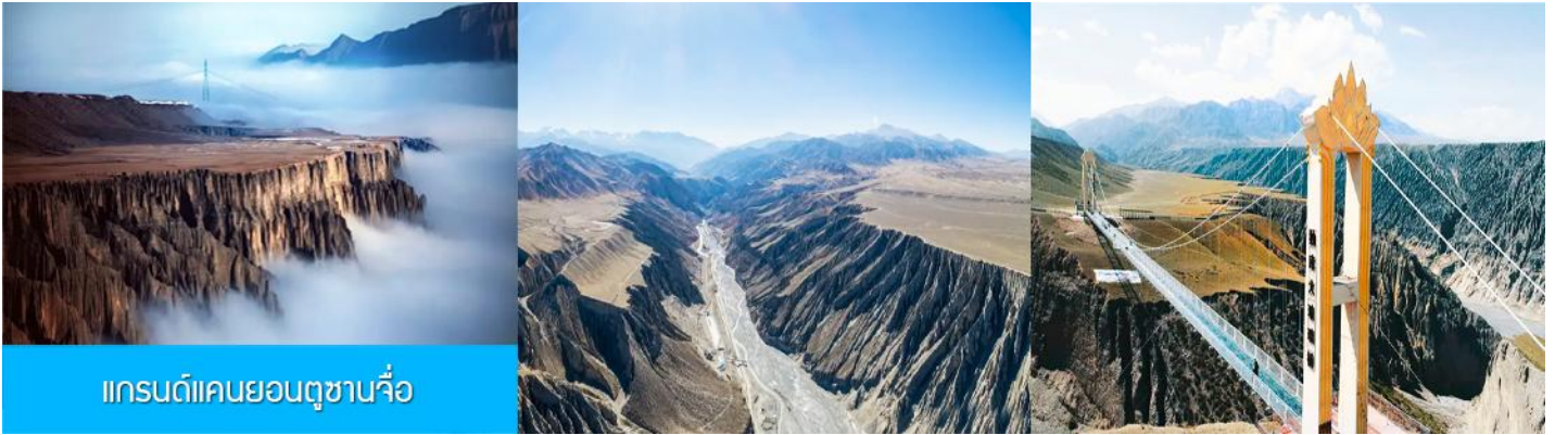
แกรนด์แคนยอนตุซซาบจื่อ