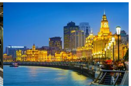
หาดไว่กาน