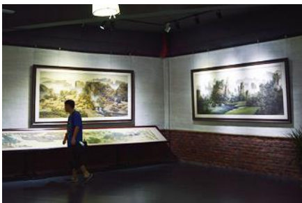
พิพิธภัณฑ์ภาพหินทราย

โปรดอ่าน ห้องพักในเมืองเก่าไม่มีลิฟท์ ท่านไม่สามารถที่จะนำกระเป๋าใบใหญ่ หรือ กระเป๋าล้อลากเล็กเข้าไปได้ ท่านต้องเตรียมกระเป๋าใบเล็กเพื่อความสะดวกในการนอนพักในเมืองเก่า, และหากท่านไหนมีความต้องการพักห้องที่เห็นวิว น้ำตกเก็บเพิ่มค่าห้องท่านละ 1,500 บาท และในเมืองเก่าไม่สามารถเสริมเตียงได้ หากท่านมา 3 ท่านต้องพักด้วยกัน หรือ 1 ท่านแยกพักเดี่ยวต้องเพิ่มค่าห้องเดี่ยว 2,500.-บาท 1 คืน ***ขอสงวนสิทธิ์หากจองห้องที่เห็นวิวไม่ได้