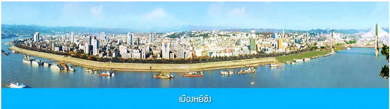
เมืองหยีซาง