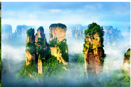
ภูเขาอวตาร