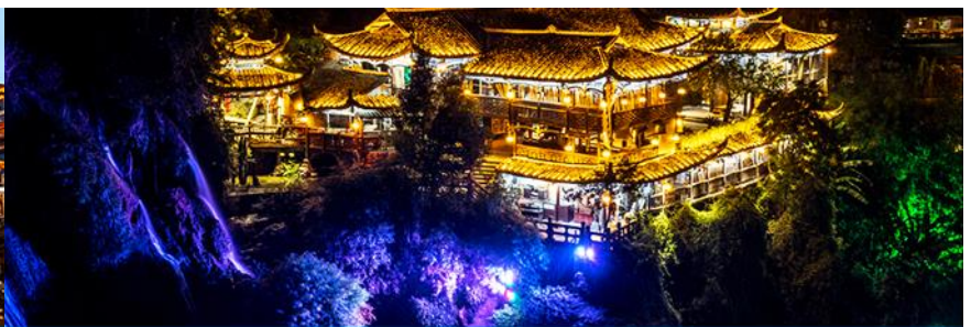
เมืองโบราณฟูหรงจิ้น