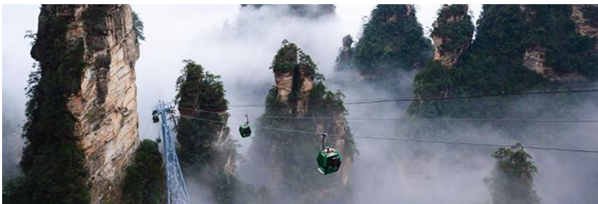
กระเช้าลจากเขาเทียนจื่อซาน

ค่ำ รับประทานอาหารค่ำ ณ ภัตตาคารในรีสอร์ทท้องถิ่น กระเป๋าสัมภาระ ทางโรงแรมดูแลขนขึ้นไปให้ พักที่ ShanDing PengQuange resort บนเขาผังหยวนเจียเจี๋ย