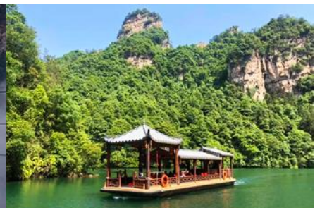
ล่องเรือทะเลสาบ เป้าเฟิงหู