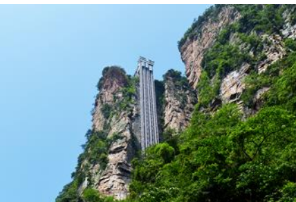
ลิฟท์แก้วไปหลง