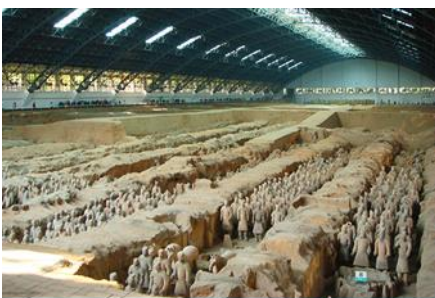
สุสานกวางกั๊กทหารม้าจิ้นซี

ค่ำ รับประทานอาหารค่ำ ณ ภัตตาคาร พักที่ XINYUAN HOTEL 4* หรือ โรงแรมในระดับเดียวกัน เมืองหั่วซ่าน