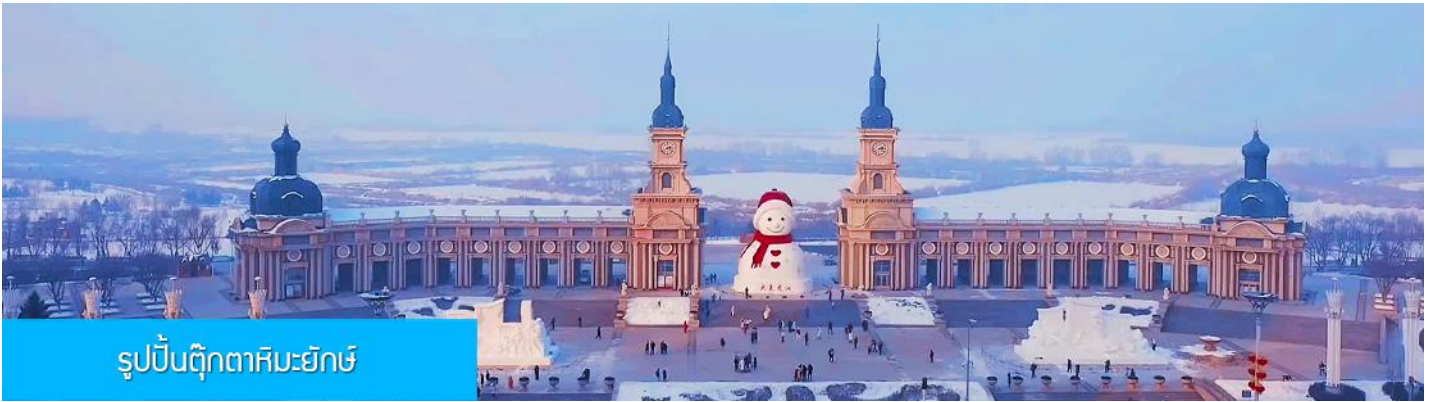
รูปปั้นตุ๊กตาคิมะฮิมะ

ความสูง 18 เมตร ที่ทางเทศบาลเมืองฮาร์บินจัดทำขึ้นในช่วงฤดูหนาวของทุกปี เช่นเดียวกับการประดับต้นคริสต์มาสในช่วงเทศกาลของชาวตะวันตก จนกลายเป็นสัญลักษณ์แห่งฤดูหนาวของเมืองฮาร์บิน