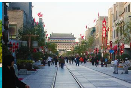
ถนนเจียนเหมิน