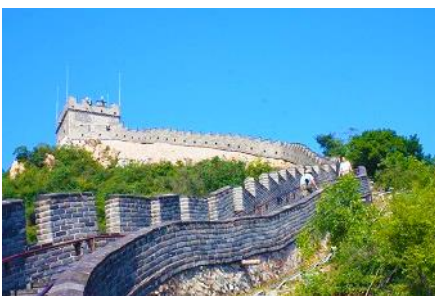
กำแพงเมืองจีนด่านวิยวกวน

พักที่ JINGLIN HTL OR HOLIDAY INN EXPRESS HTL 4* หรือ โรงแรมในระดับเดียวกันในกรุงปักกิ่ง