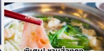
พิเศษ! ซาบูฮ่องกง