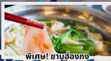
พิเศษ! ชาบูฮ่องกง