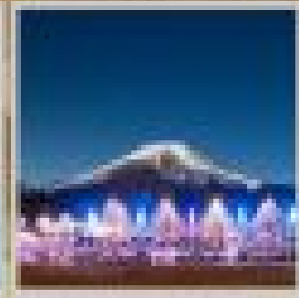
"MOUNT FUJI ILLUMINATION EXHIBITION"

ที่พัก 3 คืน | 4 คืน | 5 คืน | 6 คืน | 7 คืน | 8 คืน | 9 คืน