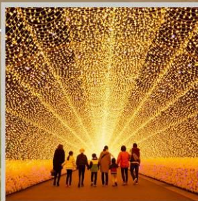
"NABANA NO SATO"