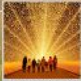
"NABANA NO SATO"